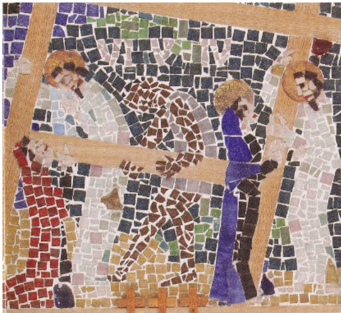
Kreuzweg: Station IV-VI (Mosaik, 1970)