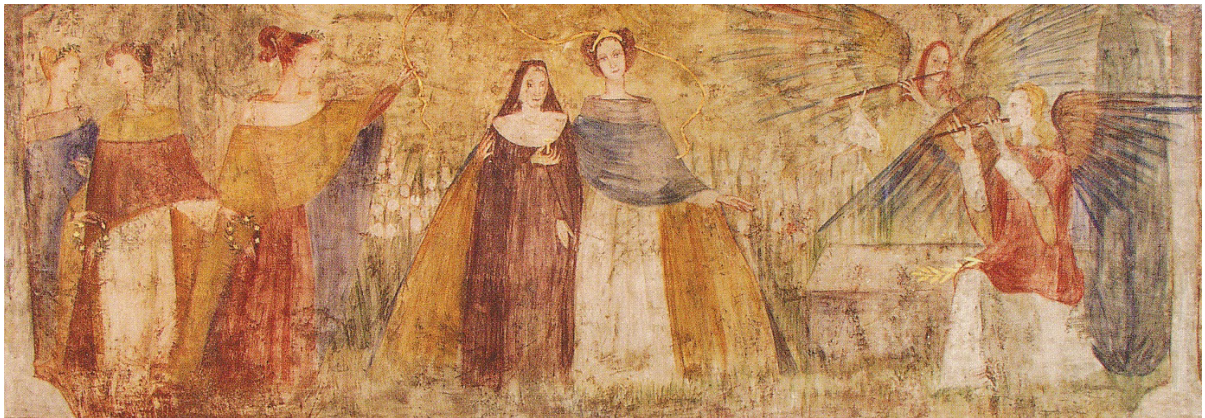
Wonnegarten, Allegorie der göttlichen Weisheit mit einer Nonne (Detail, Enkaustik, 1951)

1951 Wandmalerei und Dichtung Wonnegarten des Hl. Geistes im Kloster St. Johann im Gnadenthal in Ingolstadt