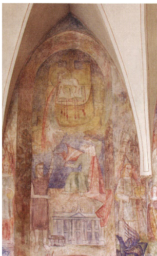
Wandmalerei im Chor der Klosterkirche (Detail, Enkaustik, 1952/53)

1953-56 Wandmalerei im Chor der Klosterkirche St. Johann im Gnadenthal